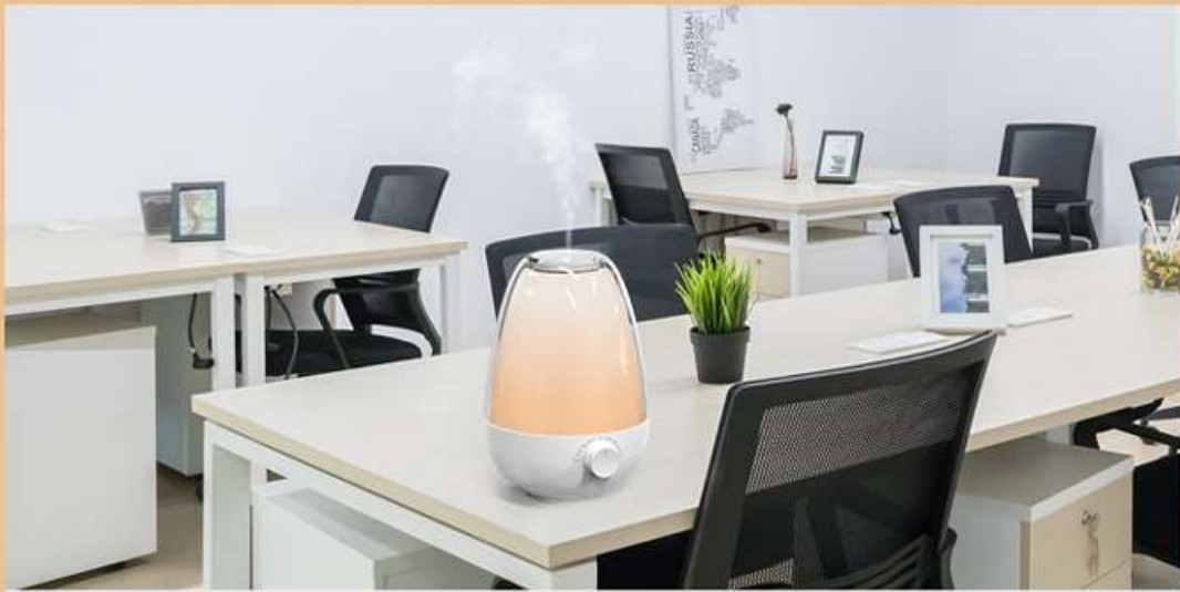
— Office —