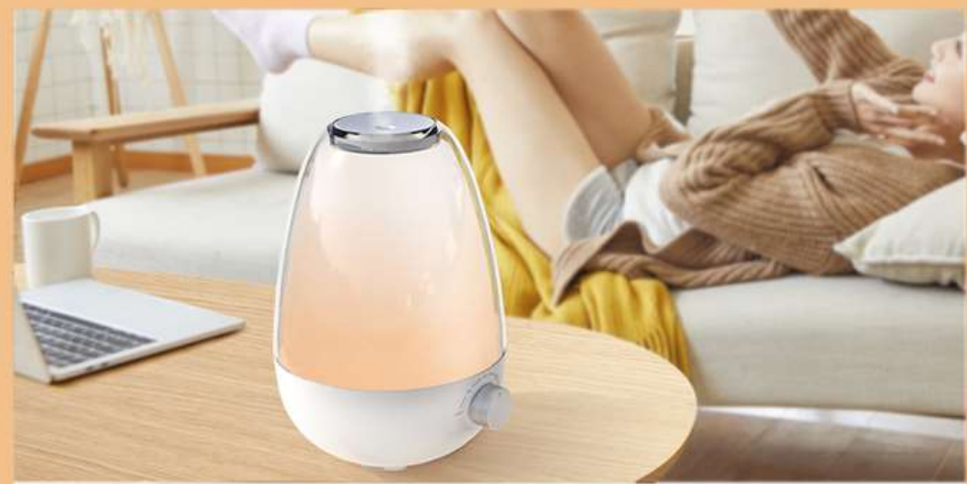
— Living Room —