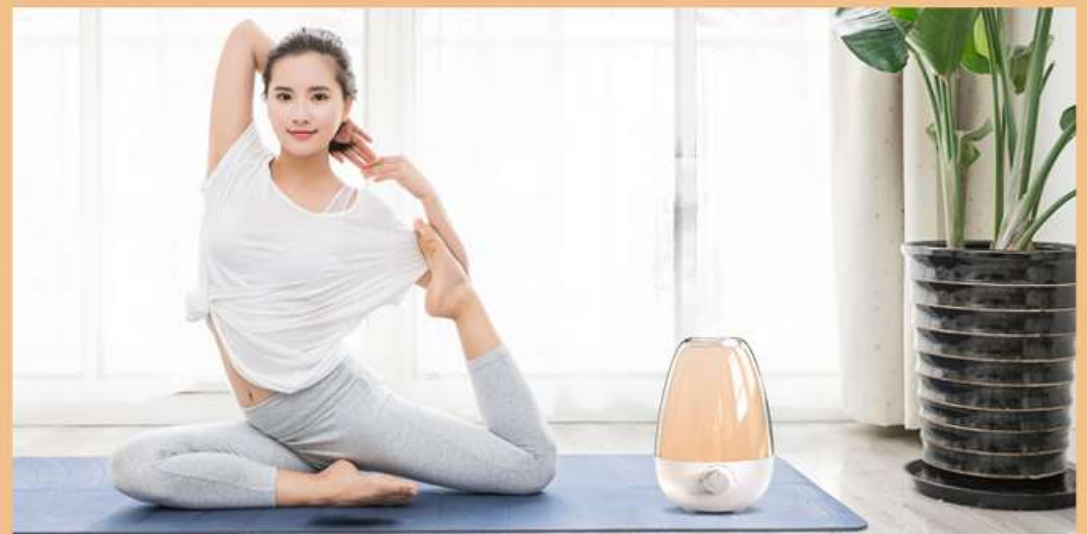
— Doing Yoga —